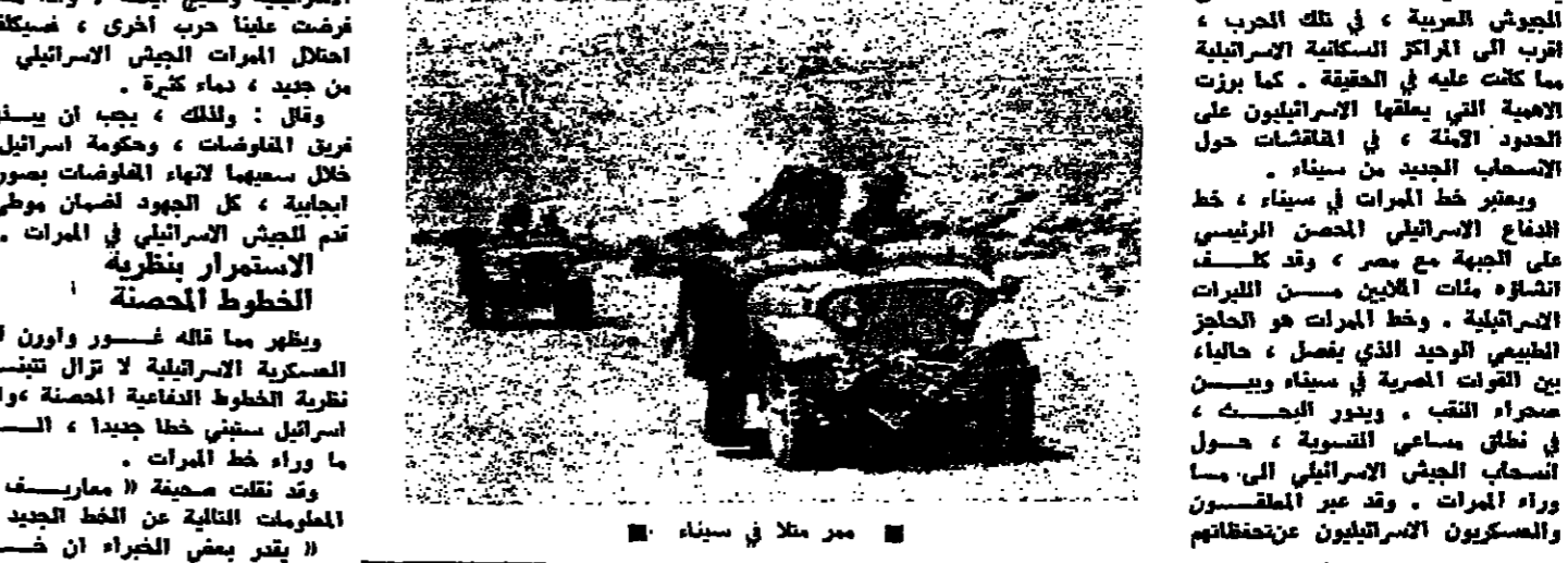
ممر ملاق في سيناء